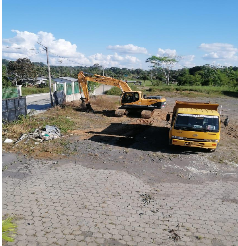
IMAGEN DE LA MAQUINARIA